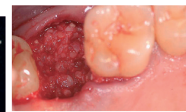
Das eingebrachte Knochenersatzmaterial