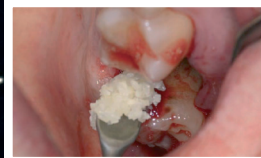
Einbringen des gewonnenen Augmentats

Vermeiden Sie 50 Vol. %-Alveolenfach-Resorption nach Extraktion durch Socket Preservation mit chair-side erzeugtem autologen Knochenaugmentat – in weniger als 15 Minuten!