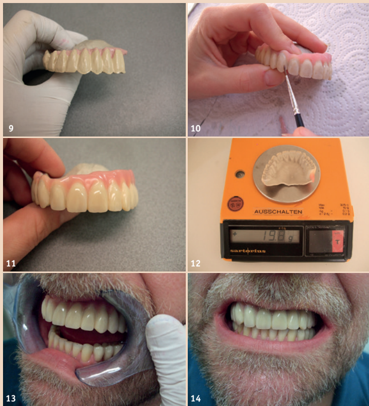
Abb. 9: Gerüst nach dem Opaquern. – Abb. 10: Individuelles Verblenden. – Abb. 11: Fertige Prothese von frontal. – Abb. 12: Gewicht nur 19,8 Gramm. – Abb. 13: Prothese in situ. – Abb. 14: Perfektes ästhetisches Ergebnis.

großen Kiefer, der den Druck während des Pressens und Knirschens noch erhöhte.