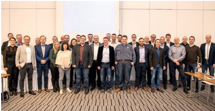
Die Labor- und ConnectDental-Spezialisten gehen auf die hohen Anforderungen der modernen Zahntechniker-Branche ein.

Digitaler Spirit trifft analoges Know-how. Henry Schein Dental erweitert Außendienst für die Betreuung zahntechnischer Labore.