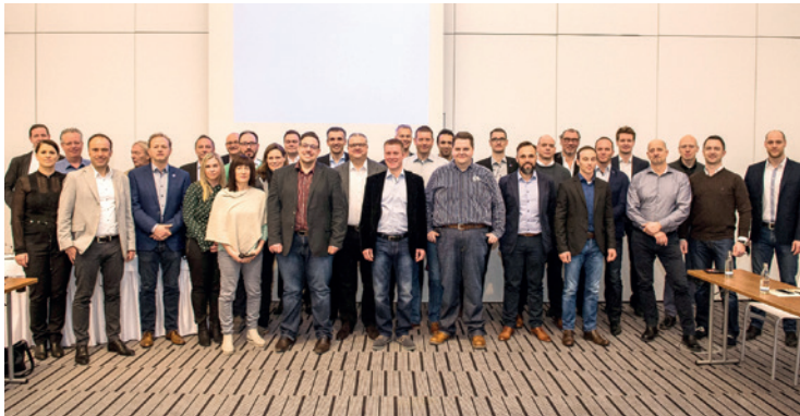
Die Labor- und ConnectDental-Spezialisten gehen auf die hohen Anforderungen der modernen Zahntechniker-Branche ein.

Digitaler Spirit trifft analoges Know-how. Henry Schein Dental erweitert Außendienst für die Betreuung zahntechnischer Labore.