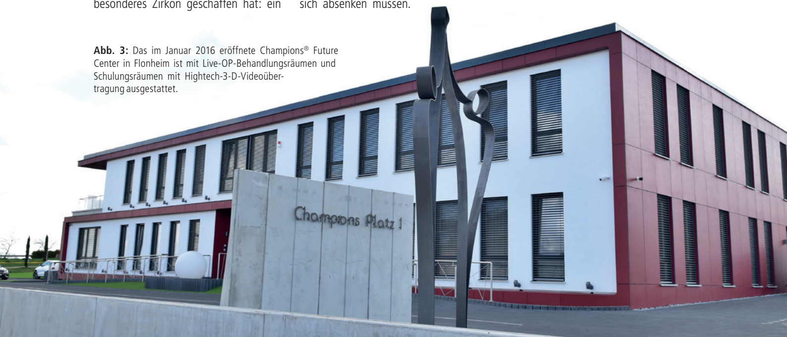
Abb. 3: Das im Januar 2016 eröffnete Champions® Future Center in Flohnheim ist mit Live-OP-Behandlungsräumen und Schulungsräumen mit Hightech-3-D-Videoübertragung ausgestattet.

Champions Platz 1 55237 Flohnheim Tel.: 0673491 4080 info@championsimplants.com