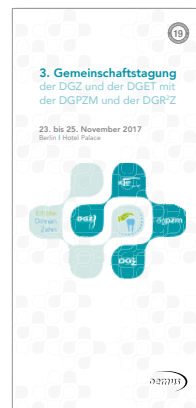
3. Gemeinschaftstagung der DGZ und der DGET