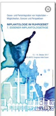
7. Essener Implantologietage