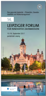
14. Leipziger Forum für Innovative Zahnmedizin