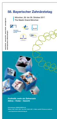
58. Bayerischer Zahnärztetag