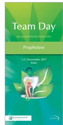
Team Day der praxisHochschule Köln