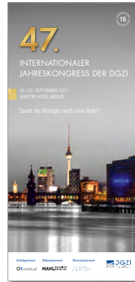
47. Internationaler Jahreskongress der DGZI