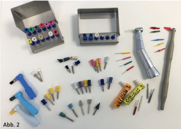
Abb. 1: Prophylaxepasten im Überblick. Für Allergiker geeignet: Lunos® neutral, DÜRR DENTAL; Cleanic® light, Kerr Hawe. Vegane Pasten: ProfiGuard, Becht. – Abb. 2: Politurmedien im Überblick. Prophylaxebürstchen, Kelche und Medien zur Interdentalraumpolitur (CPS roto, Curaden; PDH Profin manuelles Handstück, Loser).