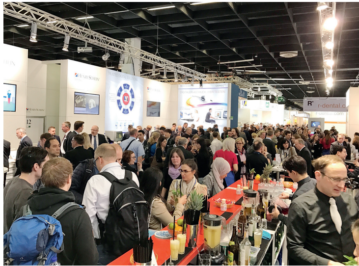
Am Messestand präsentierte Henry Schein Lösungen, mit denen Abläufe wirtschaftlich gestaltet werden können.

Um der Schnelligkeit in der Zahnheilkunde gewachsen zu sein, gewinnt die Verknüpfung digitaler Bausteine an Bedeutung. Dieser