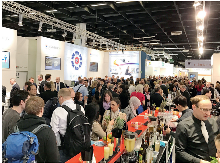
Am Messestand präsentierte Henry Schein Lösungen, mit denen Abläufe wirtschaftlich gestaltet werden können.

Um der Schnelligkeit in der Zahnheilkunde gewachsen zu sein, gewinnt die Verknüpfung digitaler Bausteine an Bedeutung. Dieser