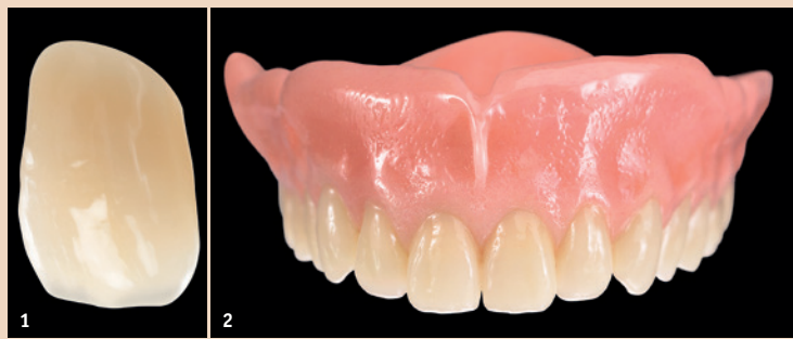
Abb. 1: Dreidimensionaler anatomischer Schichtaufbau und natürliche Oberflächentexturen sorgen für ein brillantes Farb- und Lichtspiel. – Abb. 2: In der neuen Frontzahnlinie VITAPAN EXCELL wurde das ästhetische Regelwerk konsequent umgesetzt, um eine einfache Aufstellung zu ermöglichen.

Das sieht nicht nur absolut natürlich aus, sondern erleichtert auch die Aufstellung. Denn durch die perfekte Zahnachse, die abgestimmten Winkelmerkmale und die ausgewogen lebendig-körperhafte Zahnform finden VITAPAN EXCELL Frontzähne in der ästhetischen Zone einfach und vor allem harmonisch zueinander. Breite Palatinalleisten unterstützen eine optimale Papillengestaltung. Eine effiziente Aufstellung mit exakt definierter Zentrik im Seitenzahnbereich gewährleistet der VITAPAN LINGOFORM dank seines bewährten multifunktionellen Kauflächendesigns nach dem Zahnradprinzip, das universell für alle gängigen Aufstellkonzepte in Zahn-zu-Zahn oder Zahn-zu-zwei-Zahn geeignet ist. VITAPAN EXCELL und VITAPAN LINGOFORM ist das aufeinander abgestimmte System für