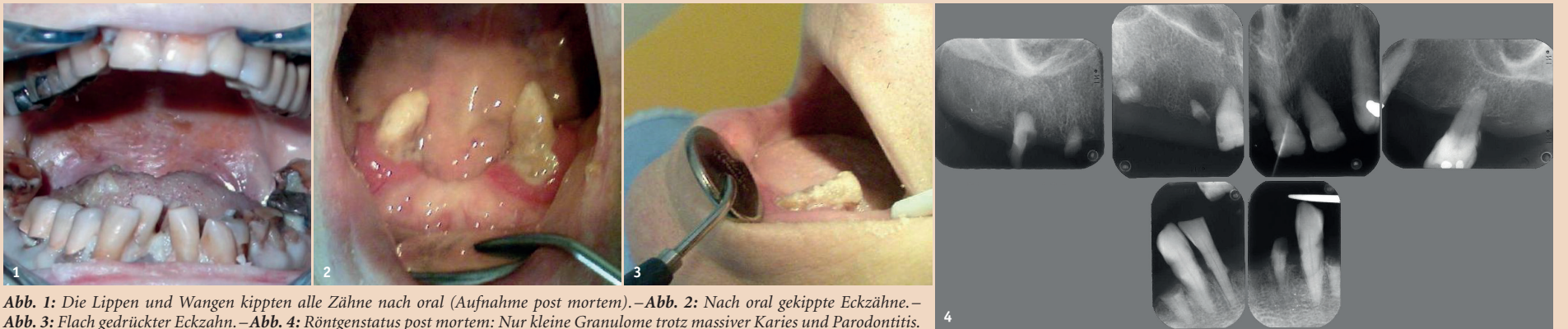
Abb. 1: Die Lippen und Wangen kippten alle Zähne nach oral (Aufnahme post mortem). – Abb. 2: Nach oral gekippte Eckzähne. – Abb. 3: Flach gedrückter Eckzahn. – Abb. 4: Röntgenstatus post mortem: Nur kleine Granulome trotz massiver Karies und Parodontitis.

Von der Empfehlung einer Räumung zur Empfehlung, die Frontzähne mit Komposit zu erhalten. Von Dr. med. dent. Walter Weilenmann, Wetzikon, Schweiz.