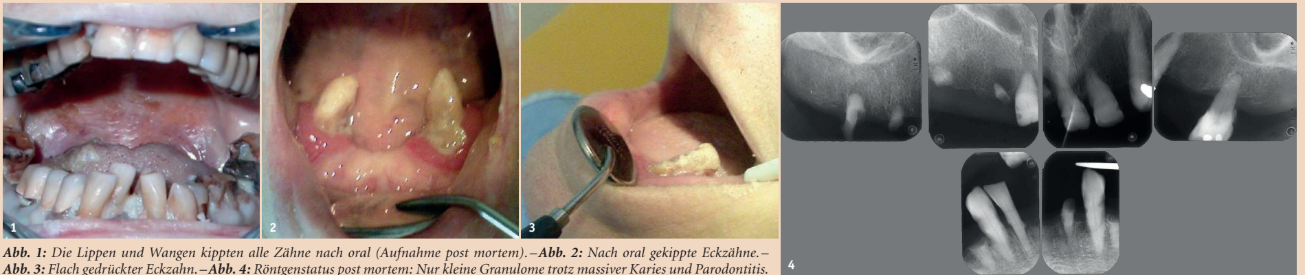
Abb. 1: Die Lippen und Wangen kippten alle Zähne nach oral (Aufnahme post mortem). – Abb. 2: Nach oral gekippte Eckzähne. – Abb. 3: Flach gedrückter Eckzahn. – Abb. 4: Röntgenstatus post mortem: Nur kleine Granulome trotz massiver Karies und Parodontitis.

Von der Empfehlung einer Räumung zur Empfehlung, die Frontzähne mit Komposit zu erhalten. Von Dr. med. dent. Walter Weilenmann, Wetzikon, Schweiz.