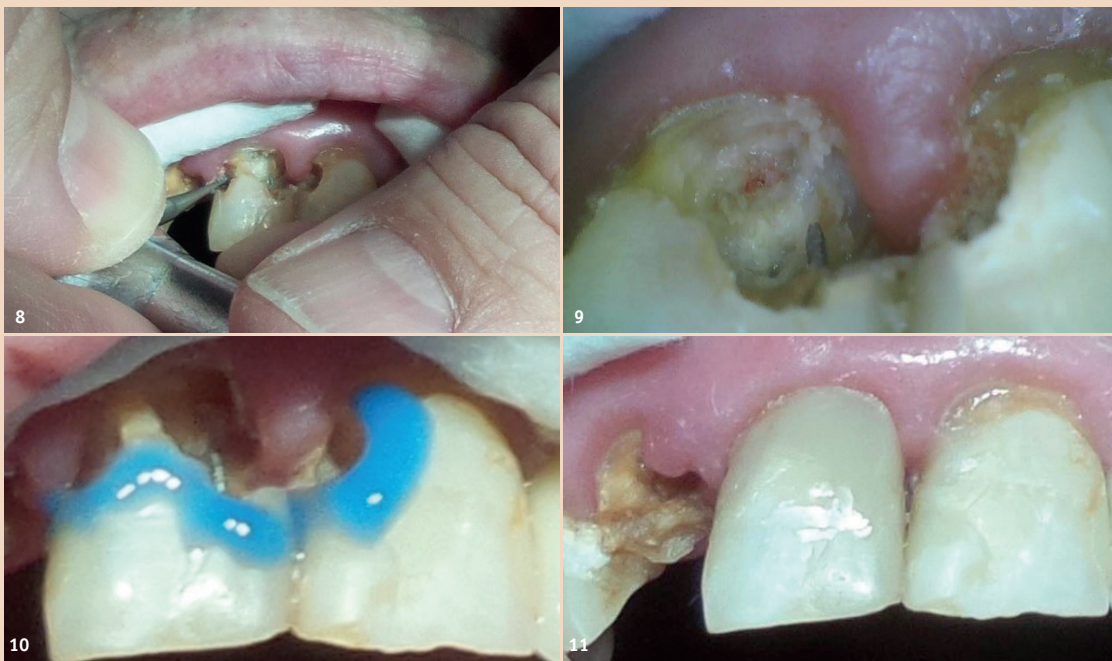
Abb. 8: Reizarmes, bimanuelles Exkavieren. – Abb. 9: Eröffnete Pulpa. Die Karies muss noch entfernt werden. – Abb. 10: Fertig exkaviert, Ätzen ohne Anschrägung, dann direkte Überkappung mit Syntac Classic und Flow. – Abb. 11: Komposit ohne Politur.

mit Rotationsbewegungen, sodass der Kopf nicht hin und her schaukelt. Die Luxationsbewegungen werden mit Pausen unterbrochen. In den Pausen finden intraalveolär zusätzliche desmodontale Ablösungsvorgänge statt. Nach der Entfernung des Zahnes wird die Alveole mit einem Finger und evtl. mit einer unterlegten Watterolle zugeedrückt, sodass möglichst wenig Blut entweicht. Nach der Koagulation wird mit trockenen und feuchten Watterollen das Blut im Mund und an den Lippen weggeputzt. Die Patienten schlafen meistens schon während der Behandlung ein. Die Heilung erfolgte bisher immer komplikationslos und ohne beobachtbare Schmerzsignale oder Verhaltensänderungen.