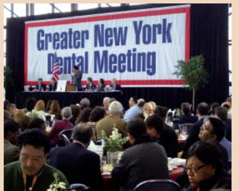
Während eines gemeinsamen Mittagessens wurde über den größten Trend, die CAD/CAM-Technik diskutiert.