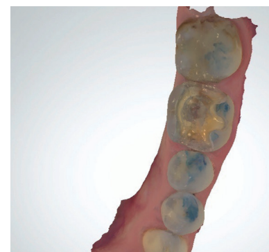
Abb. 5: Farbmarkierte Okklusion.

Fazit Zusammenfassend lässt sich kein allgemeingültiger Ratschlag für den Kauf des „richtigen“ oder „besten“ Intraoralscanners geben. Wichtig ist, die infrage kommenden Scanner im realen Einsatz