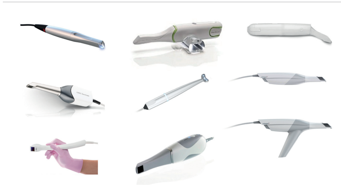
Abb. 1: Nicht nur Größe und Gewicht, auch die Form der Handstücke ist ein Entscheidungskriterium bei der Intraoralscanner-Wahl.

Der sicherlich entscheidende Faktor für jede Abformung ist die