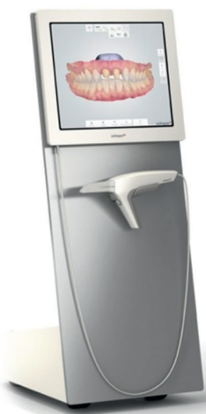
Abb. 3: Zwei Gerätevarianten werden unterschieden: die Cart- (links) und die Laptop-Version (rechts). Im Bild: TRIOS® Intraoralscanner von 3Shape.

* Baresel, W.; Baresel I.; Baresel, J.: Untersuchung und Auswertung von Vergleichsstudien zur Passgenauigkeit festsitzender Restaurationen bei intraoraler digitaler und konventioneller Abformung ( https://www.dgdoa.de/studien-der-dgdoa/ ).