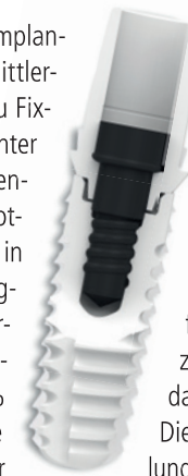
ZERAMEX® XT Implantat

Dennoch können keramische Implantate aus Zirkoniumdioxid mittlerweile eine echte Alternative zu Fixturen aus Titan darstellen. Unter Beachtung bestimmter Anwendungsmodalitäten, wie der Notwendigkeit der Ruhigstellung in der Einheilphase, kann erfolgreich mit diesen Systemen gearbeitet werden. Erste 5-Jahres-Erfolgsraten von 94,95 % unterstützen diese These und machen sie vergleichbar mit Implantaten aus Titan und empfehlen Keramikimplantate speziell bei Patienten mit einer Titanunverträglichkeit und bei Patienten, die den Wunsch nach metallfreien Restaurationen äußern. Allerdings sind noch weitere Studien erforderlich, um die Eignung von ZrO_2 als Ausgangsmaterial für dentale Implantate auszubauen. Der Schwachpunkt der einteiligen Systeme ist nach Lage der Literatur weniger in der Stabilität der Implantate als vielmehr in der Überbrückung der Einheilphase zu