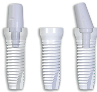
Z-Systems Z5c (zweiteilig)

Die folgende Übersicht beruht auf den Angaben der Hersteller bzw. Vertrieber. Wir bitten unsere Leser um Verständnis dafür, dass die Redaktion für deren Richtigkeit und Vollständigkeit weder Gewähr noch Haftung übernehmen kann.