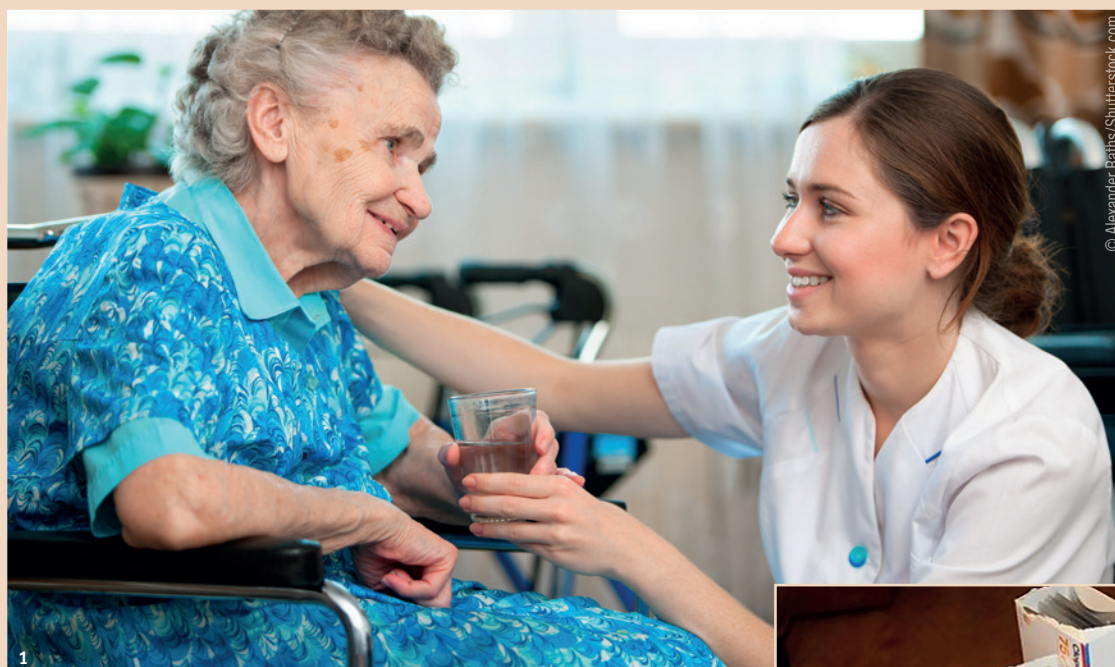
Abb. 1: Seniorin in einer Pflegeeinrichtung. – Abb. 2: Polymedikation im Alter.

Das Betreuungskonzept verfolgt drei Stossrichtungen: Schulung des Personals von Institutionen und Spitex-Organisationen mit praktischen Übungen direkt an den Betagten, eine Triagierung jedes zu betreuenden Senioren durch den leitenden Zahnarzt und Pflegeleistungen durch PASS. Prinzipiell gilt: Wer mobil ist, soll möglichst lange von seinem Zahnarzt der Wahl in dessen Praxis weiterbetreut werden. Das Team aus Zahnarzt, Dentalhygienikerin und PASS bietet hier dank optimaler Infrastruktur die beste Betreuung in vertrautem Umfeld. Die Patienten sollen bewusst angehalten