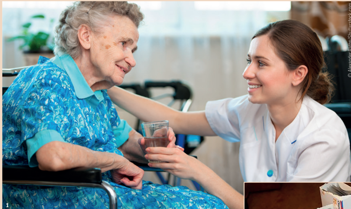
Abb. 1: Seniorin in einer Pflegeeinrichtung. – Abb. 2: Polymedikation im Alter.

Das Betreuungskonzept verfolgt drei Stossrichtungen: Schulung des Personals von Institutionen und Spitex-Organisationen mit praktischen Übungen direkt an den Betagten, eine Triagierung jedes zu betreuenden Senioren durch den leitenden Zahnarzt und Pflegeleistungen durch PASS. Prinzipiell gilt: Wer mobil ist, soll möglichst lange von seinem Zahnarzt der Wahl in dessen Praxis weiterbetreut werden. Das Team aus Zahnarzt, Dentalhygienikerin und PASS bietet hier dank optimaler Infrastruktur die beste Betreuung in vertrautem Umfeld. Die Patienten sollen bewusst angehalten