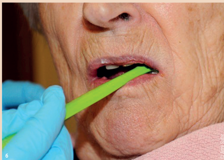
Abb. 6: Mundpflege bei Pflegebedürftigen.

Bei Gingivitis oder Mukositis führen kleinste Berührungen der Mundschleimhaut zu einer Bakteriämie grösseren Ausmasses. Hochrisikopatienten laufen Gefahr, eine Endokarditis zu erleiden. Parodontitiden schreiten bei vernachlässigter Mundpflege voran. Die For-