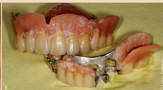
Abb. 3: Beläge und Gingivitis. – Abb. 4: Ungenügende Mundhygiene. – Abb. 5: Schmutzige Prothese.