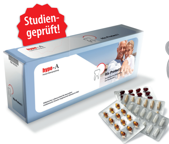
aMMP-8 - Parodontitis-Studie 2011, Universität Jena

60% entzündungsfrei in 4 Monaten durch ergänzende bilanzierte Diät