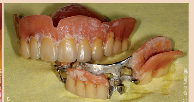
Abb. 3: Beläge und Gingivitis. – Abb. 4: Ungenügende Mundhygiene. – Abb. 5: Schmutzige Prothese.