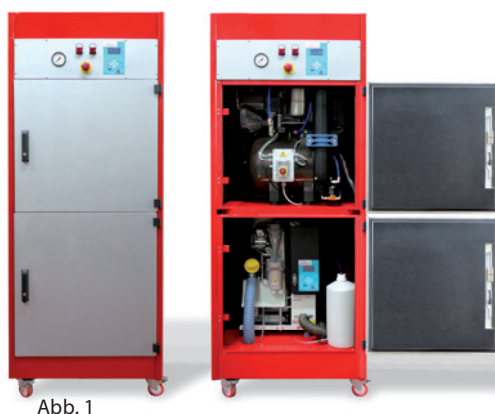
Abb. 1: Blok-Jet Silent 2 mit schwarzem Tank. Abb. 2: Dental-Absauganlage TURBO-SMART. Abb. 3: 3-Zylinder-Dental-Kompressor mit 45-Liter-Lufttank.

Der in der Absauganlage TURBO-SMART integrierte Amalgamabscheider „Hydrozyklon ISO18“ mit einer Durchflussrate von