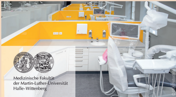
Medizinische Fakultät der Martin-Luther-Universität Halle-Wittenberg

36 modernste Behandlungsplätze stehen ab September bereit.