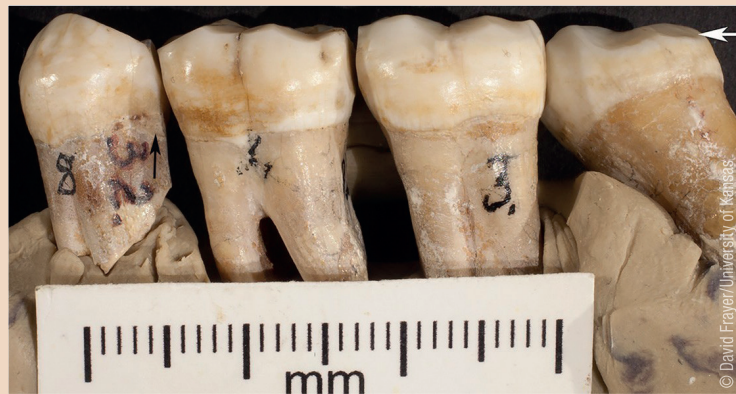
Die vier gefundenen Zähne des Neandertalers, rechts der verdrehte Prämolare.

Unter einem Lichtmikroskop betrachteten die Forscher die gefundenen vier Zähne genauer. Dabei wurden Spuren entdeckt, die von einer Art Zahnstocher zeugen könnten. Vermutet werden spitze Knochen oder harte Äste, mit denen am Zahn manipuliert wurde. Die Ursache für die prähis-