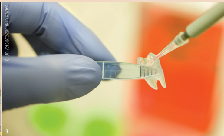
Abb. 2: Die Forschung an experimentellen Strategien für die regenerative Endodontie weist neue Wege in die Zukunft. – Abb. 3: Mikrogewebe und 3-D-Druck bieten innovative Möglichkeiten für die Endodontie.