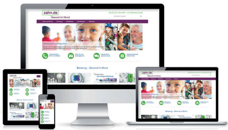
▲ Ob auf PC, Laptop, Tablet oder Smartphone: zahn.de bietet fundiertes Wissen und viel Service rund um die Zahn- und Mundgesundheits.

Unter dem Motto „Die BLZK informiert – Ihr Zahnarzt berät“ unterstützt zahn.de das persönliche Beratungsgespräch zwischen Patient und Zahnarzt in der Praxis. Die BLZK selbst bietet eine Telefonsprech-