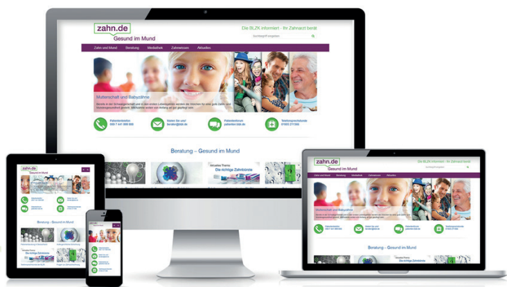
▲ Ob auf PC, Laptop, Tablet oder Smartphone: zahn.de bietet fundiertes Wissen und viel Service rund um die Zahn- und Mundgesundheit.

Unter dem Motto „Die BLZK informiert – Ihr Zahnarzt berät“ unterstützt zahn.de das persönliche Beratungsgespräch zwischen Patient und Zahnarzt in der Praxis. Die BLZK selbst bietet eine Telefonsprech-