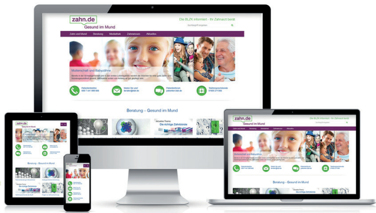
▲ Ob auf PC, Laptop, Tablet oder Smartphone: zahn.de bietet fundiertes Wissen und viel Service rund um die Zahn- und Mundgesundheit.

Unter dem Motto „Die BLZK informiert – Ihr Zahnarzt berät“ unterstützt zahn.de das persönliche Beratungsgespräch zwischen Patient und Zahnarzt in der Praxis. Die BLZK selbst bietet eine Telefonsprech-