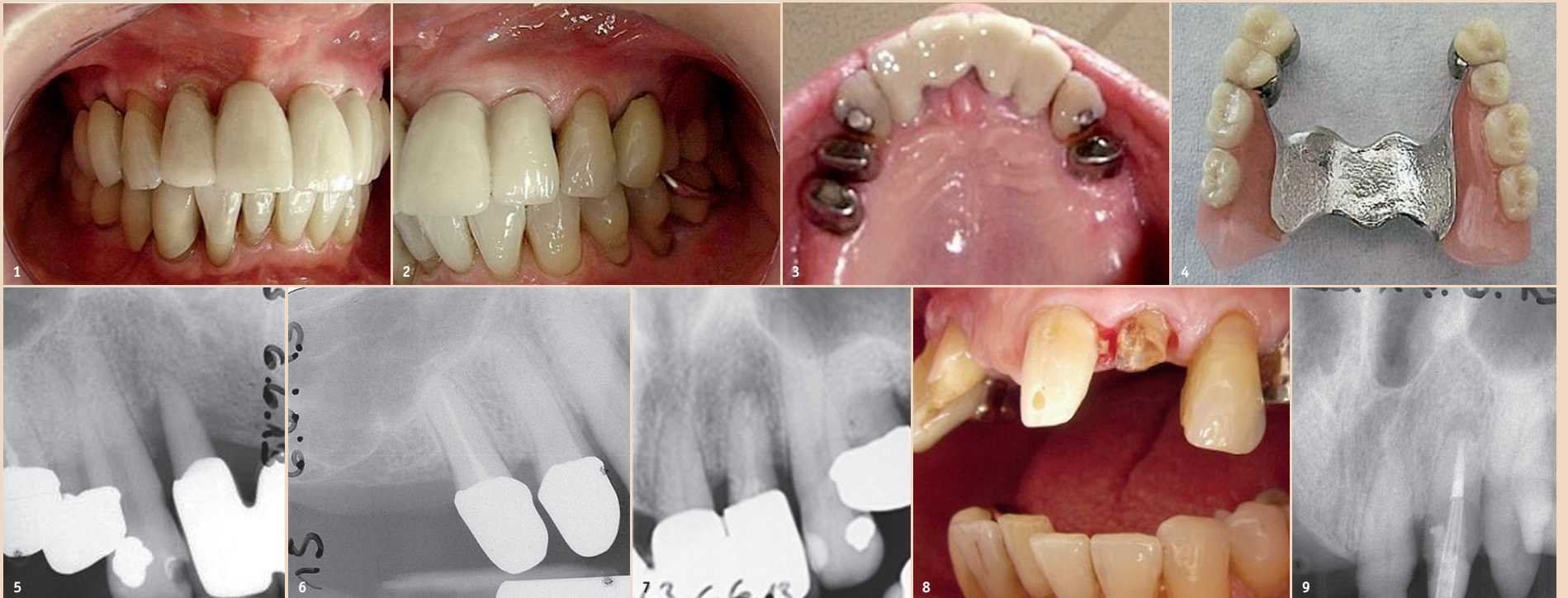
Abb. 1–4: Anfangsbefund nach ersten mundhygienisierenden Massnahmen. – Abb. 5 und 6: Parodontalabszess regio 12. – Abb. 7 und 8: Um 21 und 22 nicht unnötig zu belasten, wurde die Brücke aufgesägt, um sie abzunehmen. Hierbei löste sich der Adhäsivaufbau mit Glasfaserstift am ohnehin revisionsbedürftigen Zahn 22. – Abb. 9: Der apikale Verschluss vor WF regio 22 sowie die Perforationsdeckung mesial erfolgte mit MTA-Zement.

Dieser Fall beschreibt die Möglichkeit, wie durch endodontische Therapie Zähne erhalten werden, diese aber auch gleichzeitig zu wertvollen Pfeilern werden können. Von Dipl.-Stom. Burghard Falta, M.Sc., Bochum, Deutschland.