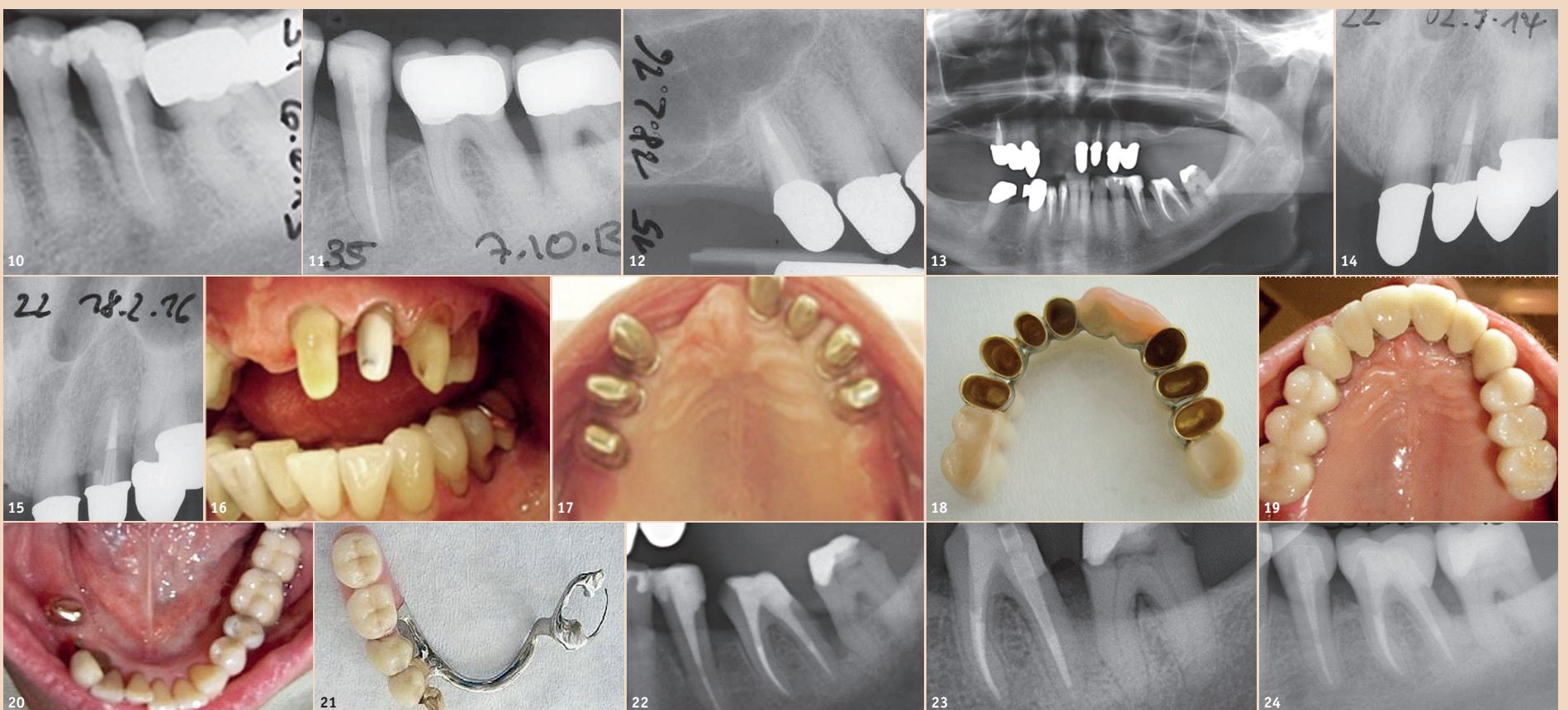
Abb. 10 und 11: Endodontische Revision 35 – röntgenologische Anfangsbefunde. – Abb. 12–15: Röntgenkontrollen regio 22 und 15. – Abb. 16–19: Zementierung der Innenteleskope und nach Aushärtung und vollständiger Überschussentfernung spannungsfreies (!) Aufsetzen der Galvanobrücke. – Abb. 20 und 21: Kombiniert festsitzend-herausnehmbarer UK-Zahnersatz. – Abb. 22 und 23: Ausschnitt aus dem OPG vor dem und Zahnfilm unmittelbar nach dem parodontalchirurgischen Eingriff.

Sowohl der apikale Verschluss vor WF regio 22 als auch die Perforationsdeckung mesial (alio loco – entstanden beim Versuch, den Glasfaserstift zu inserieren) wurden mit MTA-Zement vorgenommen (Abb. 9). Mitte August 2013 wurde der Zahn 15 endodontisch revidiert. Der Zahn 35 war bereits wegen grossen Hartschubstanzverlustes, Sekundärkaries und einer als infiziert anzusehenden WF als überkronungsbedürftig diagnostiziert worden, jedoch nicht ohne vorherige endodontische Revision. Diese erfolgte Anfang Oktober 2013 (wie alle WKB bei dieser Patientin) in einer Sitzung (Abb. 10