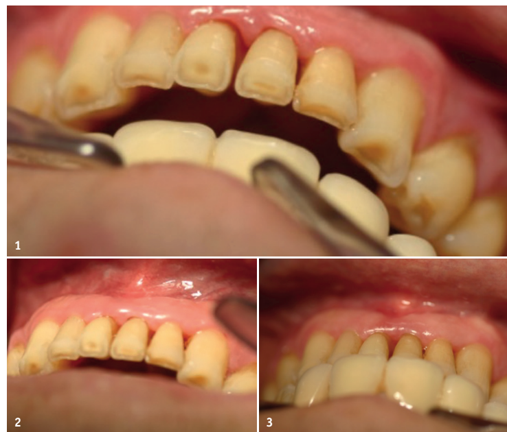
Abb. 1: Ausgangsbefund im Frontzahnbereich: Gingivitis und Konkremete. – Abb. 2: Taschentiefe mesial ca. 4 mm. – Abb. 3: Physiologische Färbung am Zahn 31, Taschentiefe mesial ca. 3 mm.

Eine Woche später betrug die Taschentiefe am Zahn 31 mesial 3 mm und die Gingiva zeigte eine physiologische Färbung (Abb. 3).