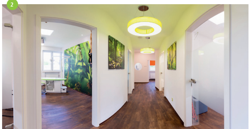
Abb. 1: Röntgenbereich: Die zweifach geschwungene Wand sorgt für eine angstfreie Atmosphäre. – Abb. 2: Flur: Gerundete Wände machen die langen Flure freundlicher. – Abb. 3: Wartebereich: Individuelles Loungeelement, gegenüber Bildschirm in Trockenbauwand integriert.

Bei der Planung einer Kinderzahnarztpraxis ist das nicht anders. Und wenn der Einrichtungsidee das Thema Wald zugrunde liegt, ist die Zusammenarbeit mit einem Inneneinrichter gut, der sowohl die Anforderungen kennt, die aus technischen, hygienischen und Arbeitsstätten-Richtlinien entstehen, als auch alle Leistungen der Innenarchitektur in seinem Portfolio hat.