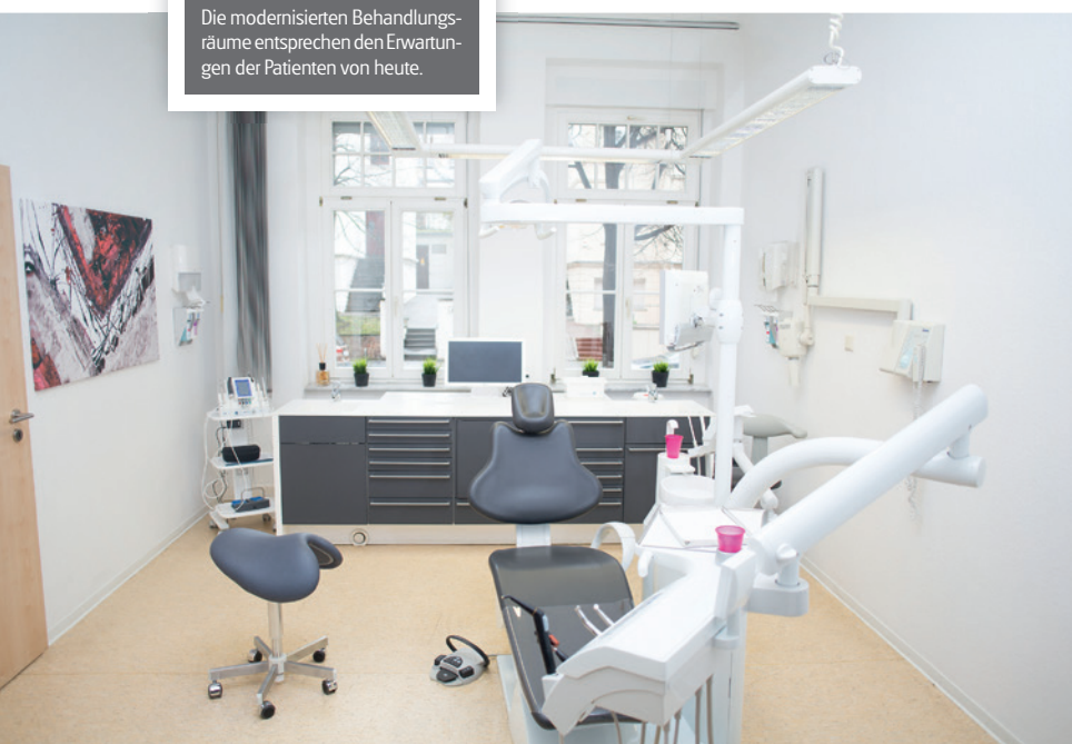
Die modernisierten Behandlungsräume entsprechen den Erwartungen der Patienten von heute.

„UNSERE PATIENTEN SCHÄTZEN DIE MODERNE, UND FAMILIÄRE ATMOSPHERE UND FÜHLEN SICH EINFACH WOHL.“