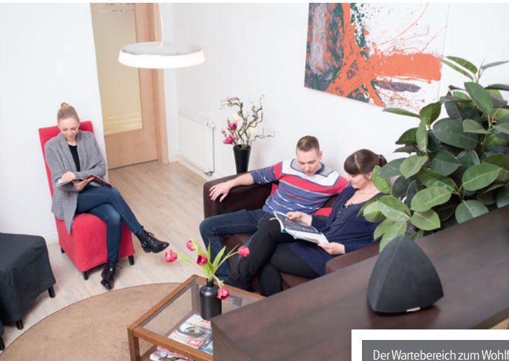
Der Wartebereich zum Wohlfühlen für Groß und Klein.