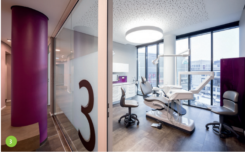
Abb. 3: Heute erwarten Patienten auch ein ansprechendes Ambiente in der Zahnarztpraxis ihrer Wahl.