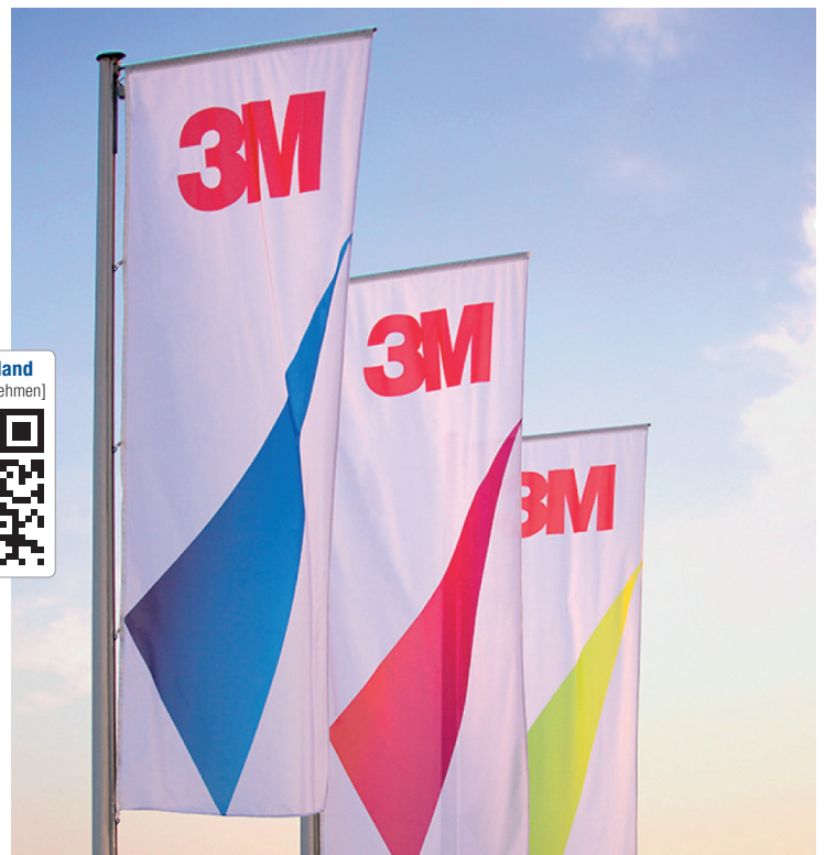
Langfristig setzt sich 3M stets ambitionierte Ziele: Bis 2025 plant das Unternehmen beispielsweise die Energieeffizienz weltweit im Verhältnis zum Nettoumsatz um 30 Prozent zu steigern und auch seine Kunden bei der Reduktion von CO 2 -Emissionen zu unterstützen.

Fokussierung auf die Kunden Hervorgehoben wurde außerdem, dass 3M anstrebt, den eigenen Nachhaltigkeitshebel maximal auszuweiten. Dabei steht die Zusammenarbeit mit Kunden, Wissenschaft und Interessensgruppen noch stärker als bislang im Fokus. Auf Basis der wissenschaftlichen Expertise und der Technologien des Unternehmens unterstützt 3M seine Kunden dabei, ihre eigenen Nachhaltigkeitsziele zu erreichen. Zu Lösungen im öko-