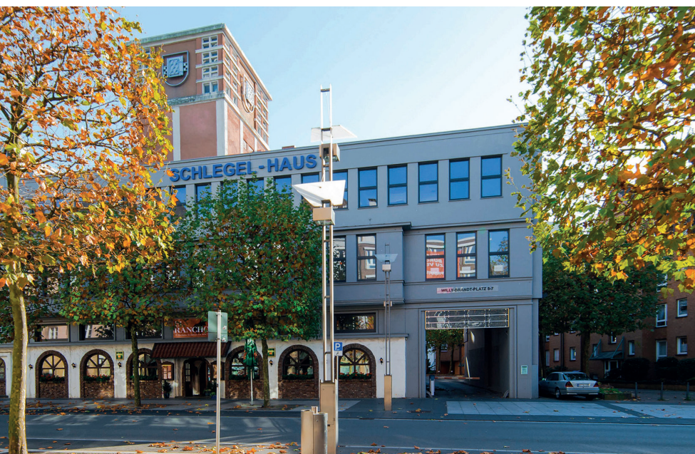
Abb. 1: Seit 2013 ist die mednaht GmbH ein autorisierter Vertrieb von ATRAMAT – International Farmaceutica SA mit Sitz in Bochum, mitten im Ruhrgebiet.

AtraGlide® besitzt eine modifizierte und extrem schlanke diamantförmige Spitze mit vier mikrogeschärften Schneidekanten, die einen einfachen und schonenden Eintritt in das Gewebe ermöglichen. Ihre glatten Schneiden sind von hoher Oberflächengüte, expandieren hinter der Nadelspitze nach außen und maximieren somit die Penetrationsfähigkeit durch das Gewebe. Im weiteren Verlauf ziehen sich die Schneidekanten wieder nach innen zusammen und verschwinden übergangslos im Nadelkörper. Die somit erzeugte Nadelgeometrie sowie die spezielle thermische Beschichtung reduziert das Gewebetrauma in effektiver Weise und perfektioniert die chirurgische Kontrolle der Nadelführung. Die reduzierte