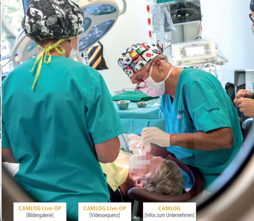
CAMLOG Live-OP [Bildergalerie]