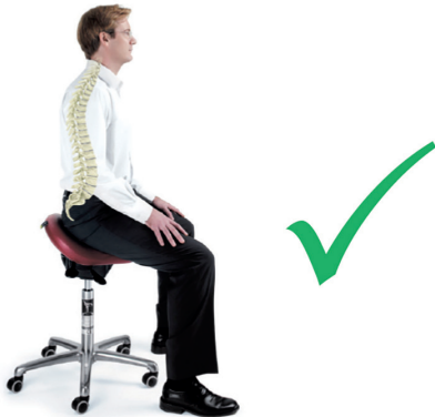
Abb. 2: Vorgebeugtes Sitzen verursacht denselben Bandscheibendruck wie das Heben schwerer Gewichte. Abb. 3: Das Becken wird leicht nach vorne gekippt. Die Lendenwirbelsäule nimmt automatisch eine natürliche Haltung ein und reduziert den Druck auf die Bandscheibe.

lasten und vermeidet somit eine ungesunde Schonhaltung. Eine Sitzposition mit nach vorne gekippten Becken erleichtert eine Aufrechterhaltung der natürlichen Lendenwirbelkrümmung und reduziert somit den Bandscheibendruck. Studien mit Kindern und Rehabilitationspatienten wiesen nach, dass das Sitzen mit nach vorne gekippten Becken die Funktion der oberen Extremitäten erleichtert. Eine zahnärztliche Studie 2 legt nahe, dass sich auch die Fehlerquote in einer Sitzposition mit nach vorne gekippten Becken reduziert und gleichzeitig die Geschicklichkeit erhöht.