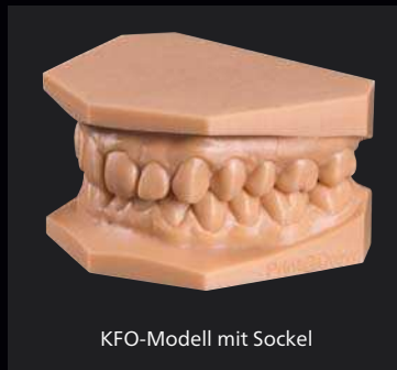
KFO-Modell mit Sockel