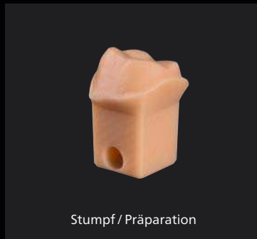
Stumpf / Präparation