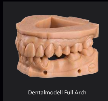
Dentalmodell Full Arch