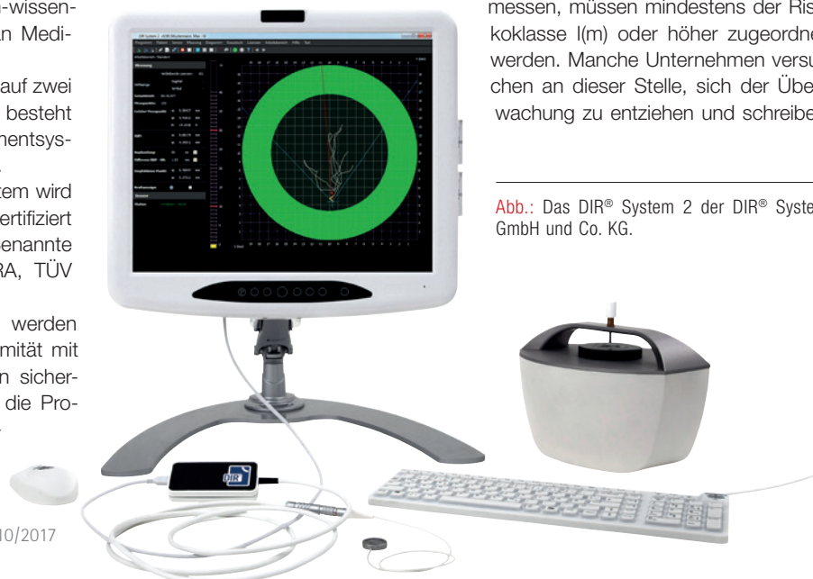
Abb.: Das DIR® System 2 der DIR® System GmbH und Co. KG.

Medizinprodukte, die einen Parameter messen, müssen mindestens der Risikoklasse I(m) oder höher zugeordnet werden. Manche Unternehmen versuchen an dieser Stelle, sich der Überwachung zu entziehen und schreiben