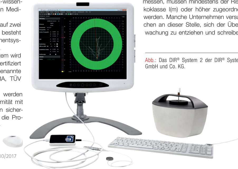
Abb.: Das DIR® System 2 der DIR® System GmbH und Co. KG.

Medizinprodukte, die einen Parameter messen, müssen mindestens der Risikoklasse I(m) oder höher zugeordnet werden. Manche Unternehmen versuchen an dieser Stelle, sich der Überwachung zu entziehen und schreiben