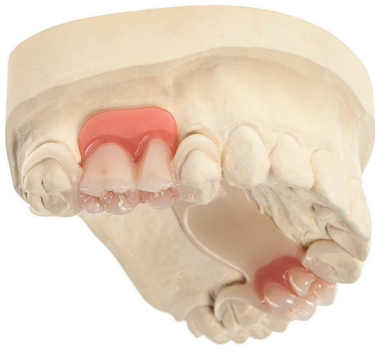
Metallersatz für Modellgussgerüste: Modellgussprothese mit Gerüst aus Polyoxymethylen (POM).