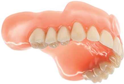
Kunststoffalternative bei MMA-Allergikern: Monomerfreie totale Prothese aus Polyamid.