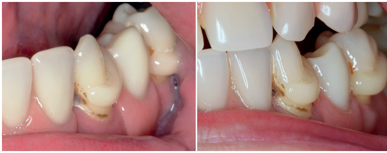
Abb. links: Zahnfarbene Klammer nach Eingliederung. Abb. rechts: Zahnfarbene Klammer nach zehntonatiger Tragezeit ohne ersichtliche Farbveränderung