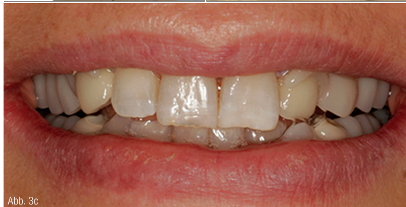
Patientenfall: Abb. 1a: Ausgangssituation mit beschliffenen Zähnen 13 und 22. Abb. 1b: Eingegliederte verblendete Zirkonoxidkronen. Abb. 1c: Eingegliederte Modellgussprothese mit Gerüst und Klammern aus Polyoxymethylen (POM), fertiggestellt mit herkömmlichem Kaltpolymerisat. Abb. 2a: Ausgangssituation mit beschliffenen Zähnen 34 und 44. Abb. 2b: Eingegliederte Innenteleskope aus Zirkonoxid. Abb. 2c: Eingegliederte teleskopverankerte Prothese mit Gerüst aus Polyetheretherketon (PEEK), verblendet mit ESPE Sinfony (3M). Abb. 3a: Gerüst aus PEEK für eine teleskopverankerte Prothese. Abb. 3b: Gerüst aus POM für eine klammerverankerte Prothese. Abb. 3c: Frontalansicht mit eingegliedertem, klammerverankerter Zahnersatz mit Gerüst aus POM und kaum ersichtlichen Klammern an den Zähnen 13 und 22.

den Zähnen 12 und 23. Die Patientin klagte beim bisherigen Zahnersatz über einen anhaltenden metallischen Geschmack, ein generalisiertes Unwohlsein und lokale Schleimhautreizungen im Bereich der metallischen