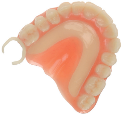
Metallersatz für Modellgussgerüste: Teilprothese mit Verstärkung aus POM.