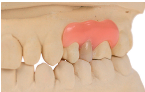
Kunststoffalternative bei MMA-Allergikern: Flexible Interimsprothese aus Polyamid.

tienten. Generell ist für die Herstellung von hypoallergenem Zahnersatz eine räumliche Abgrenzung aus dem konventionellen Laborbetrieb sinnvoll, um Verunreinigungen der Werkstoffe durch Metall- und PMMA-Stäube auszuschließen.