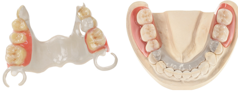
Abb. links: Teleskop-/Modellgusskombination aus PEEK. Abb. rechts: Teleskopierender PEEK-Modellguss

Ein durchgeführter Epikutantest wies eine Unverträglichkeit gegenüber Bestandteilen der verwendeten CoCr-Legierung nach. Die daraus folgende psychosomatische Belastung führte zu einer emotionalen Ablehnung gegenüber jeglicher prothetischer Versorgung, die Metalle beinhaltet. Daher entschied sich die Zahnärztin in Beratung mit ihrem Dentallabor zur Herstellung der prothetischen Versorgung aus einem Hochleistungskunststoff unter komplettem Verzicht auf metallische Elemente.