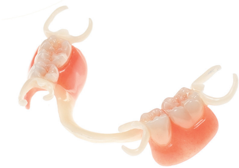
Metallersatz für Modellgussgerüste: Modellgussprothese mit Gerüst aus POM.