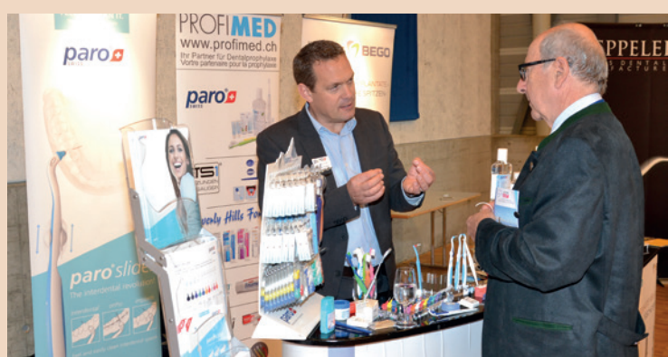
Fachlicher Austausch in der Dentalausstellung.

Info-Anforderung für Fachkreise Fax: 0451 - 304 179 oder E-Mail: info@hypo-a.de