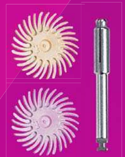
3M™ ESPE™ Scotchbond™ Universal Adhäsiv

Hohe Haftwerte, klinisch bewährt seit mehr als vier Jahren.