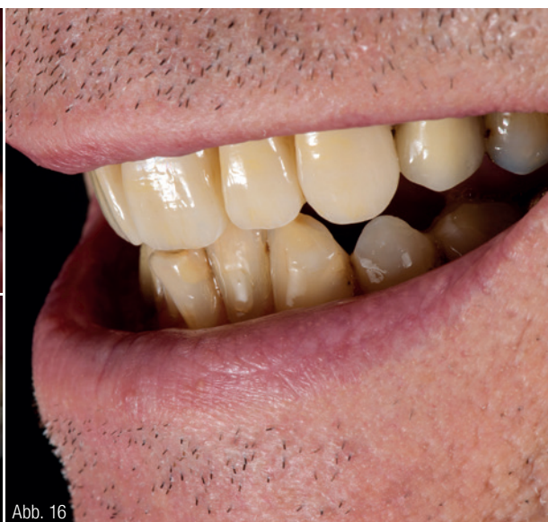
Abb. 14: Behandlungsergebnis – Gesamtansicht. Abb. 15: Detailsicht der Restaurationen drei Wochen nach deren Eingliederung. Abb. 16: Ansicht von lateral.

dem Sintervorgang, wenn der Werkstoff seine finale Festigkeit erreicht hat. Eine Anpassung erfordert jedoch auch in diesem Zustand deutlich weniger Aufwand als die Bearbeitung von tetragonalem Zirkoniumoxid. Final wurden mit Malfarben (IPS Ivocolor, Ivoclar Vivadent) individuelle farbliche Akzente gesetzt und die Versorgungen schließlich glasiert. Die Abbildungen 9 und 10 zeigen die fertiggestellten Versorgungen im Labor.