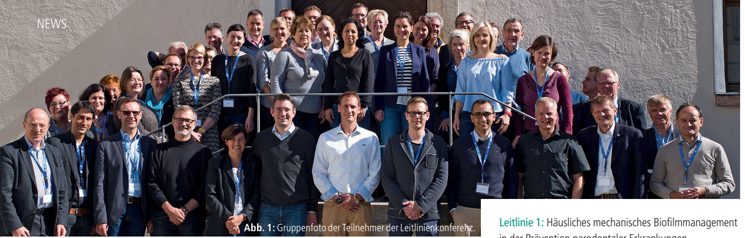
Abb. 1: Gruppenfoto der Teilnehmer der Leitlinienkonferenz.