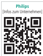
Philips [Infos zum Unternehmen]