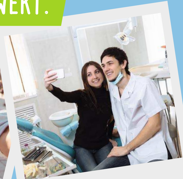
Mein erster Patient