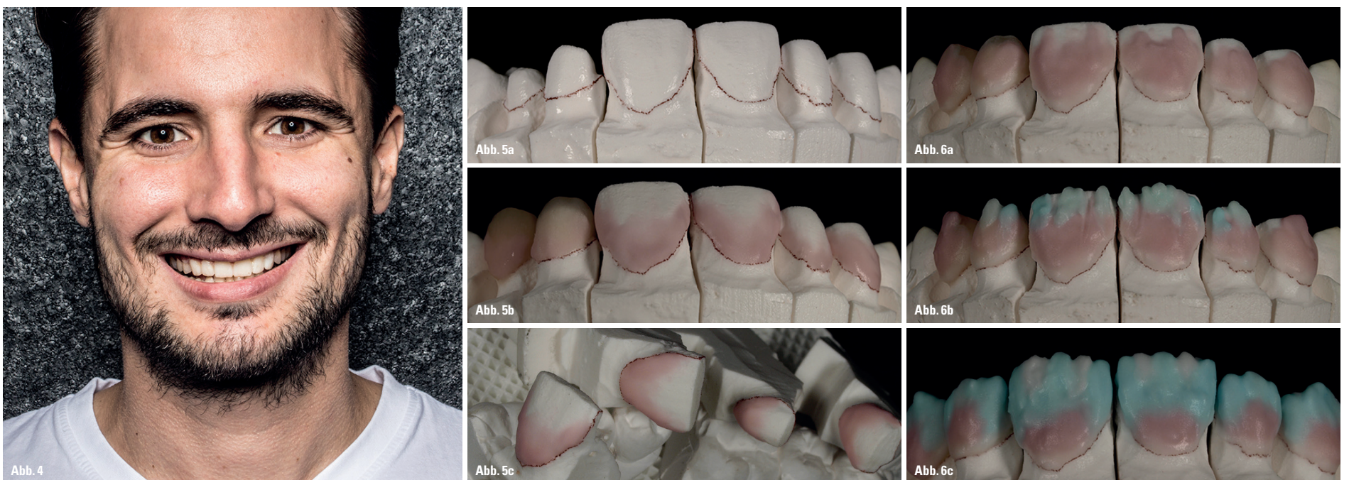
Abb. 4: Das Mock-up wurde leicht modifiziert und ebenfalls mittels Foto- und Videoaufnahmen dokumentiert. – Abb. 5a–c: Die sehr geringen Schichtstärken und das selektive Auftragen der Keramikmassen ermöglichen es dem Zahntechniker, äußerst naturgetreue Effekte und eine gute farbliche Adaption im Gingivabereich zu schaffen. – Abb. 6a–c: Diese Technik erfordert sehr viel Erfahrung und Geschick.

und keine größeren Verfärbungen haben, kann diese Farbe als natürlicher Farbräger dienen. Der Keramikaufbau richtet sich nach der Farbgebung und dem Wax-up in Größe und Form.