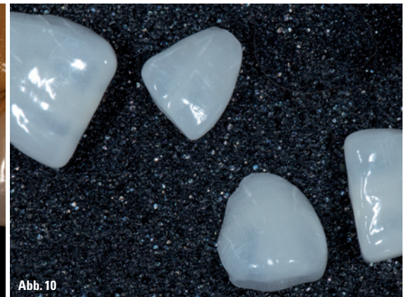
Abb. 7a und b: Ansicht von lateral der Veneers auf 11 und 21. – Abb. 8: Für die natürliche Imitation werden gezielt Lichtleisten gesetzt. – Abb. 9: Die fertigen Veneers nach der Politur. – Abb. 10: Ansicht vor Anprobe und adhäsiver Befestigung – hauchdünne Gestaltung (0,3mm) und hohe Transluzenz.