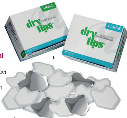
Abb. 1: Reflective DryTips® von Microbrush®. – Abb. 2: Prophylaxeprodukte von Young Dental. – Abb. 3: Produkte für die Kinderprophylaxe von Zooby®.

Sonderkonditionen gelten für Pasten und DPAs von Young Dental und Zooby® sowie für die Parotispflaster DryTips®. Im Angebot sind außerdem die Applikatoren Ultrabrush und TRU von Microbrush®. Die vielseitigen Tools sind biegsam und verharren ohne Rückfederung in der gewünschten Position. Nicht absorbierende Fasern ermöglichen