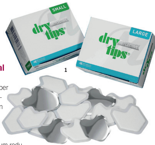
Abb. 1: Reflective DryTips® von Microbrush®. – Abb. 2: Prophylaxeprodukte von Young Dental. – Abb. 3: Produkte für die Kinderprophylaxe von Zooby®.

Sonderkonditionen gelten für Pasten und DPAs von Young Dental und Zooby® sowie für die Parotispflaster DryTips®. Im Angebot sind außerdem die Applikatoren Ultrabrush und TRU von Microbrush®. Die vielseitigen Tools sind biegsam und verharren ohne Rückfederung in der gewünschten Position. Nicht absorbierende Fasern ermöglichen