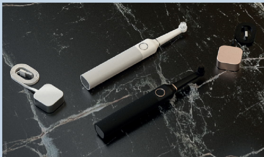
Neustes Designerstück auf minilu.de: Die oszillierende Zahnbürste von Bruzzoni.

Mit ihrem eleganten Look überzeugt die Bruzzoni Designzahnbürste auf ganzer Linie und adelt jedes Badezimmer: Formvollendet mit schlankem Griffelement aus mattem Kunststoff mit softer Gummihülle ist sie