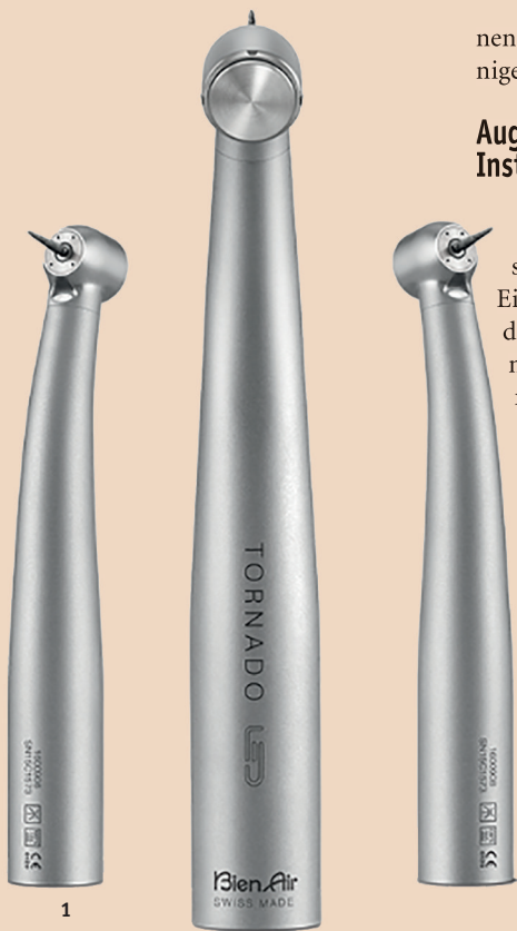
Abb. 1: Eine durchdachte Innovation aus Design und Konstruktion: Die Turbine Tornado aus dem Hause Bien-Air.

Die Schallquellen im Behandlungsraum sind vielfältig und vor allem eines: auf Dauer gesundheitsschädigend. Von Kerstin Oesterreich, Leipzig, Deutschland.