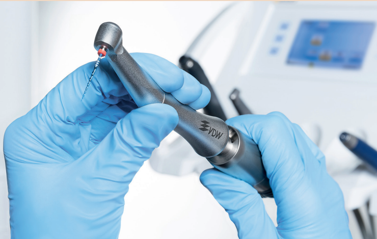
RECIPROC® direct Winkelstück.