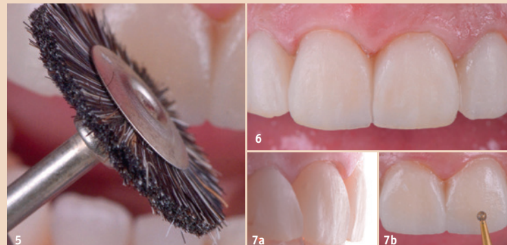
Abb. 5: Das Mock-up wurde in den Mund eingesetzt. Die Oberflächen wurden nachbearbeitet. – Abb. 6: Fertiges Mock-up. Die Validierung erfolgte anhand von Fotos und Videos. – Abb. 7a und b: Die Oberflächen des Mock-ups wurden leicht nachbearbeitet.