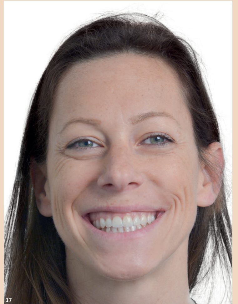
Abb. 16: Lippenbild mit den fertigen Restaurationen. – Abb. 17: Porträtbild – die Erwartungen der Patientin wurden erfüllt.

Ätzel (Total Etch) geätzt und abgespült.