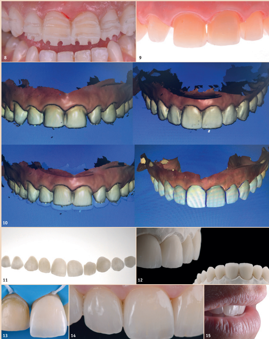
Abb. 8: Zielgerichtete Präparation der Zähne mit eingesetztem Mock-up. – Abb. 9: Die präparierten Frontzähne in der Nahansicht. Abb. 10: Überlagern der CAD-Daten der digital abgeformten Präparationen sowie des Mock-ups. Abb. 11: Die zum Einsetzen vorbereiteten Veneers. – Abb. 12: Modellsituation nach der CAD/CAM-gestützten Fertigung der keramischen Verblendschalen. – Abb. 13: Adhäsives Einsetzen der keramischen Veneers unter Kofferdam. – Abb. 14: Nahansicht der eingegliederten Veneers. – Abb. 15: Textur und Zahnform wirken natürlich und harmonieren miteinander.

der Ästhetik erfolgte anhand von Fotos und Videos, die auch von der Patientin begutachtet werden konnten ( Abb. 6, 7a und b ). Nun wurden die Zähne mittels eines Kugelfräasers bei eingesetztem Mock-up präpariert (Galip Gurel 2003) ( Abb. 8 ). Dieses Vorgehen kommt den Ansprüchen an einen möglichst minimalen zahnmedizinischen Aufwand entgegen. Die präparierten Zähne ( Abb. 9 ) wurden mit dem Intraoralscanner abgeformt. Mit dem Silikon Schlüssel wurde die provisorische Versorgung hergestellt.