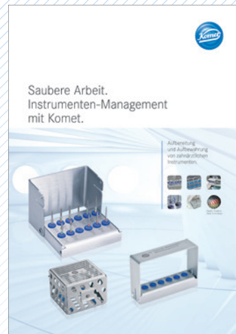
Praktische Broschüre Alles auf einen Griff!

andere Instrumentenstände als konservativ tätige Kollegen, Kliniken arbeiten mit anderen Umfängen als Praxiszahnärzte. Während früher auf großen Instrumentenständern 30 und mehr Instrumente Platz fanden, hat Komet den Trend hin zu kleineren, hoch individuellen Sets gesetzt. Ein breites Angebot an Instrumentenständern erlaubt nun ein vernünftiges Abwägen: groß, klein, hoch, tief, für die Prophylaxe, die Endodontie, für Schallspitzen und vieles mehr. Wer sich hier rational und individuell ausstattet, wird den Vorteil erleben.