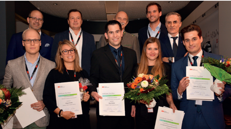
Award-Preisträger und Expertenjury des 14. Talent Award.

Der 3M Oral Care European Talent Award bot am 17. Oktober 2017 im oberbayerischen Seefeld 21 Nachwuchstalente aus verschiedenen europäischen Ländern sowie Südafrika und Pakistan die einmalige Möglichkeit, mit einem 15-minütigen Vortrag über ein Forschungsprojekt oder eine klinische Arbeit ihrer Wahl ihre Präsentations-Skills unter Beweis zu stellen. Gewinner des