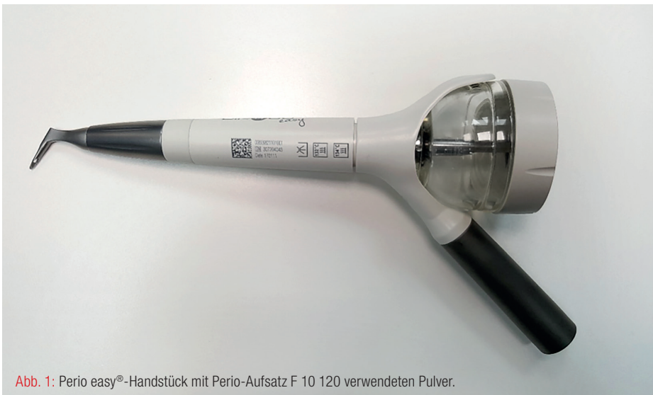
Abb. 1: Perio easy ® -Handstück mit Perio-Aufsatz F 10 120 verwendeten Pulver.

Eine Weiterentwicklung dieser Instrumentierungsprinzipien stellt das von ACTEON/Satelec neu entwickelte Air-N-Go ® easy-Gerät dar. Die als Air-Polishing bezeichneten Pulver-Wasser-Strahlgeräte sind bereits seit mehreren Jahren, sowohl im Rahmen der supragingivalen als auch der subgingivalen Anwendung, erfolgreich im Einsatz (Übersicht in Flemmig et al., Randomized controlled trial assessing efficacy and safety of glycine powder air polishing in moderate-to-deep periodontal pockets. J Periodontol, 2012. 83[4]:444–52). Die Indikationserweiterung auf den subgingivalen Bereich ermöglichte die Verwendung minimalinvasiver und damit gering abrasiver Pulversysteme und einem, für die Behandlung der infizierten Wurzeloberflächen, adäquaten Design des Kopfstückes. 7 Pulverstrahlssysteme wie das ACTEON Air-N-Go ® easy (Abb. 1) konnten mit den entsprechenden Düsenaufsätzen (die Air-N-Go ® Perio easy nozzle) als