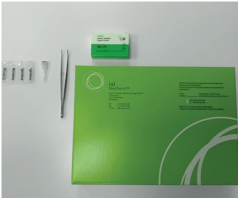
Abb. 4: iai PadoTest 4•5® Kit.

die Effizienz von mikroabrasivem Air-Polishing getestet haben. 7–9,11,13–20 Auffallend positiv entwickelten sich in beiden Gruppen das klinische Bild in Bezug auf Sondierungstiefe, Bleeding on Probing und gingivale Rezessionen. Diese Verbesserungen waren auch noch nach zwölf Wochen mit statistischer Signifikanz feststellbar (Tab. 3). Der Clinical Attachment Level, als kompositorischer Faktor, zeigte keine signifikante Veränderung über den Verlauf des ausgewählten Untersuchungszeitraumes.