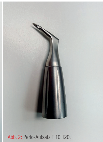
Abb. 2: Perio-Aufsatz F 10 120.