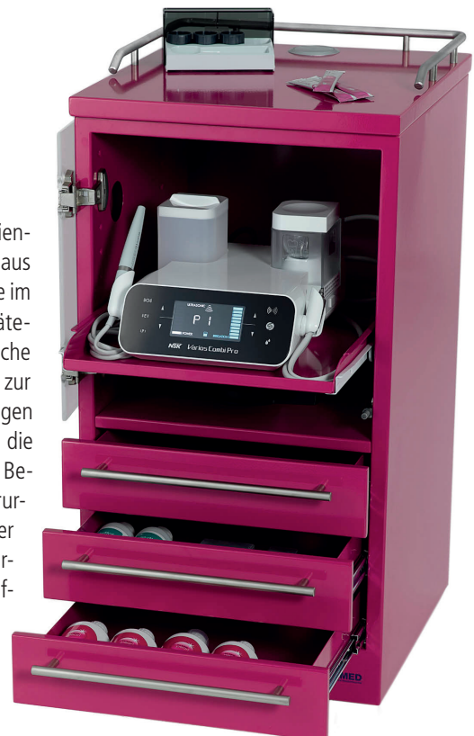
Abb. 1: Der Gerätewagen P3 aus der P-Serie erlaubt es dem Behandler, seine Geräte und Instrumente sicher und immer griffbereit zu verstauen.

Mit den unterschiedlichen Serientypen stellt das Unternehmen aus Waiblingen für fast alle Einsätze im Praxisalltag verschiedene Gerätewagen und Instrumententische sowie das passende Zubehör zur Verfügung. „Unsere Gerätewagen der E- und D-Serie sorgen für die optimale Anwendung in den Bereichen Endodontie und Chirurgie. Die vorhandenen Geräte der Praxis sind hier perfekt untergebracht und sofort ohne Aufbau und Abbau einsatzbereit“,