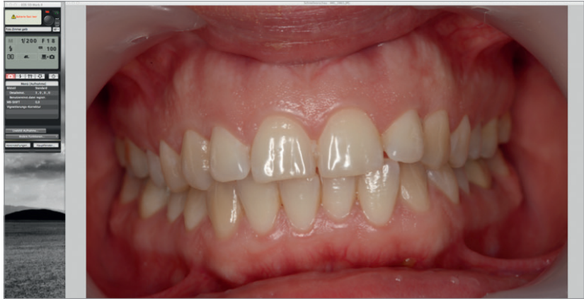
Abb. 4: Screenshot zur Qualitätskontrolle der Patientenfotos, Übertragung via Wi-Fi. Fehler hier: Kippung der Okklusionsebene.

Besondere Sorgfalt sollte auch bei folgenden Fragen erfolgen: Wer macht diese Fotos? Wie werden die Qualitätskontrolle, die Zuordnung der Bilder, die etwaige Nachbearbeitung und die Speicherung der Fotos gesichert? In unserer Praxis werden die intra- und extraoralen Fotos am Anfang und am Ende der Behand-