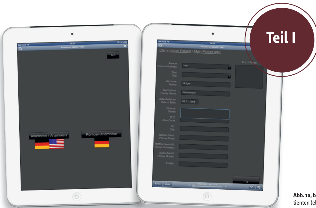
Abb. 1a, b: Digitale Datenerfassung des Patienten (elektronischer Anamnesebogen).