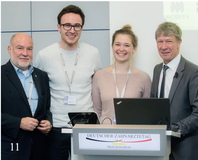
Das war der Studententag 2017.