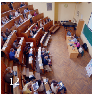
Europas Zahnmedizinstudenten beschließen neue Satzung.