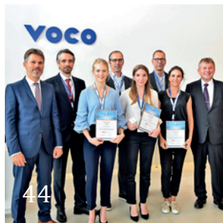
Die Gewinner der VOCO Dental Challenge 2017.