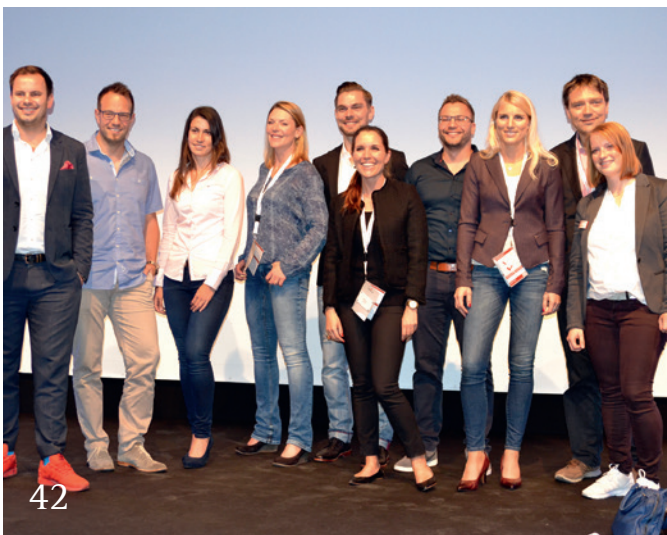
Der Weg zur eigenen Praxis.