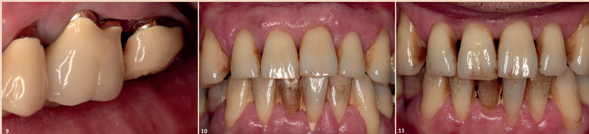
Abb. 9: Gingivale Rezessionen nach Kronenversorgung. – Abb. 10: Frontalansicht vor Initialtherapie beim dicken Biotyp. – Abb. 11: Rezessionen nach Initialtherapie trotz dickem Biotyp.

Für die Adhäsivtechnik ist der Kofferdam ein gutes Hilfsmittel, um eine adäquate Trockenlegung zu erreichen. Bei der Auswahl der Kofferdamklammer sollte beim dün-