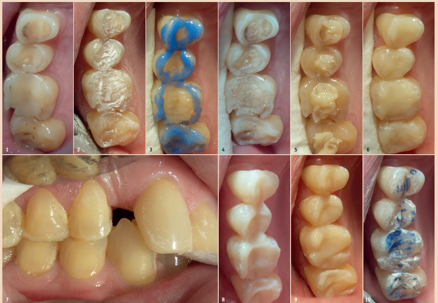
Abb. 1: Zähne 7654+, Ausgangssituation mit kleinen Defekten in Schmelz und Dentin. – Abb. 2: Schmelz angefrischt, Füllungsflächen aufgeraut. – Abb. 3: Auch unsichere Flächen wie bei Zahn 17 werden geätzt. – Abb. 4: Deutlich sichtbares Dentin nach dem Ätzen. – Abb. 5: Simultaner Aufbau der Zahngruppe. – Abb. 6: Komposit flach modelliert vor dem Zubeißen. – Abb. 7: Zubeißen auf Zellstofftupfer zur Bisserrhöhung. – Abb. 8: Impressionen im weichen Komposit. – Abb. 9: Ausmodelliertes Komposit vor dem Härten. Man beachte die sauberen Interdentalräume. – Abb. 10: Lauter Vorkontakte nach dem Härten.