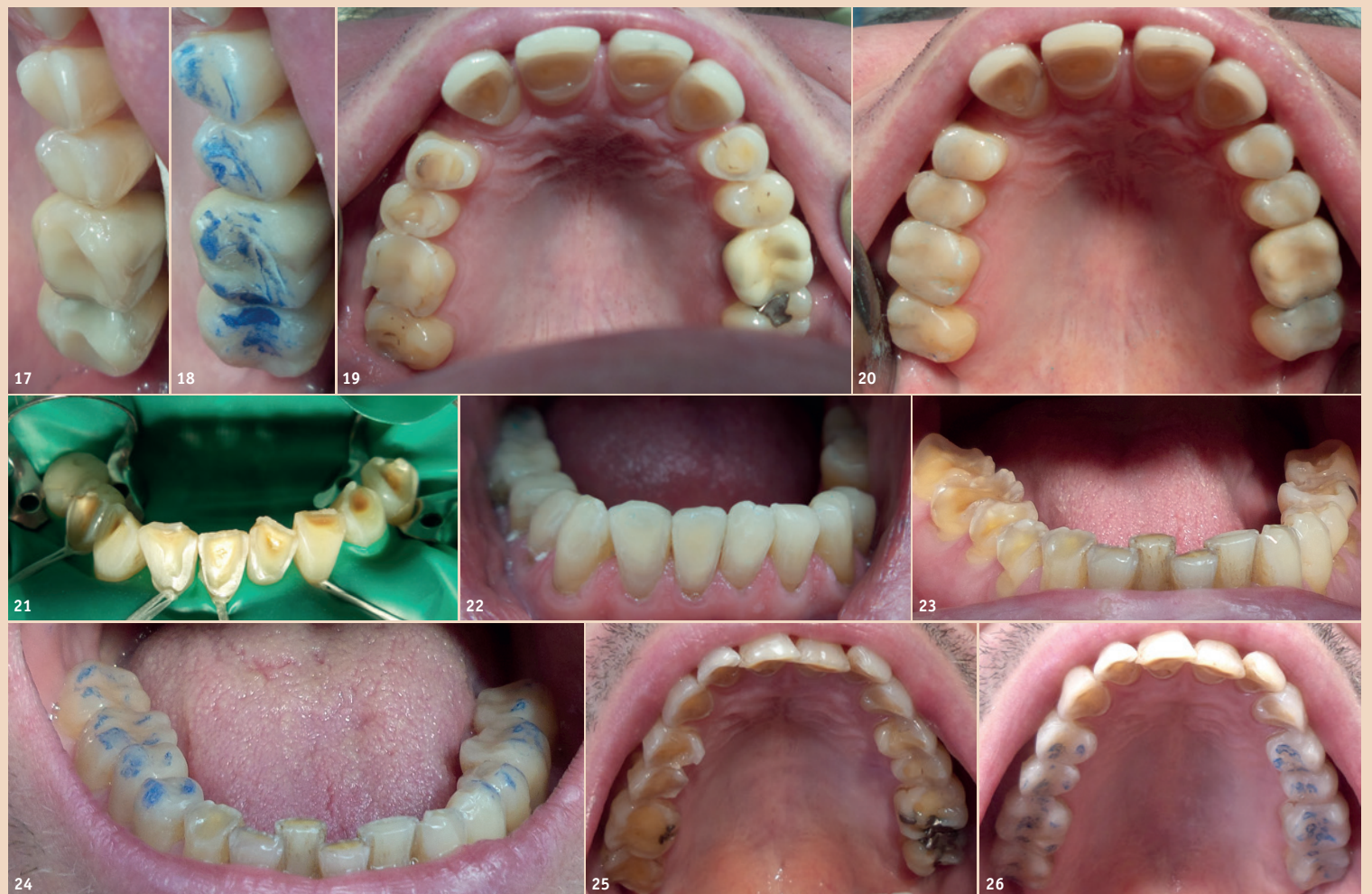
Abb. 17: Impressionen nach dem Zubeißen. – Abb. 18: Situation nach dem Härten. Man beachte die Balancekontakte auf allen Zähnen. – Abb. 19: Fall 1 vorher. – Abb. 20: Fall 1 nachher. – Abb. 21: Fall 2 vorher. – Abb. 22: Fall 2 nachher. – Abb. 23: Fall 3 Unterkiefer vorher. – Abb. 24: Fall 3 Unterkiefer nachher. – Abb. 25: Fall 3 Oberkiefer vorher. – Abb. 26: Fall 3 Oberkiefer nachher.

positränder, eingesunkene Kontaktflächen und Absplitterungen im Komposit. Ähnliche Langzeitschäden sind auch bei indirekten Aufbauten zu beobachten, aber Komposit kann man besser reparieren als teurere Materialien. Die Zunahme der Erosionen und Biss-senkungen beruht nicht zuletzt auf der Fluoridprophylaxe. Zwar gibt es heute in der ersten Lebenshälfte weniger Karies als vor 20 Jahren, dafür kommen in der zweiten Lebenshälfte mehr Abrasionsgebisse vor. Diese minimalinvasiv und bezahlbar zu restaurieren, ist eine anspruchsvolle Herausforderung für Allgemeinpraktiker.