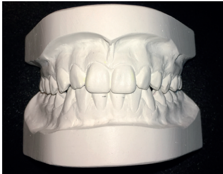
Abb. 1: Originalmodell.

Kommt es zu einem Gutachten, sind dem Gutachter die Behandlungsunterlagen zur Verfügung zu stellen. (Die Unterschiede bei der vertragszahnärztlichen Versorgung und der Privatbehandlung werden als bekannt vorausgesetzt.) In nahezu allen Fällen