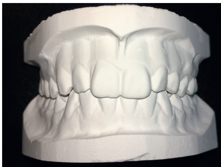
Abb. 3: Fräsmodell.

müssen aus den vorliegenden Datensätzen wieder körperliche Modelle erstellt werden. Die Akzeptanz von Datensätzen mit entsprechenden Viewern ist unter Gutachtern eher eingeschränkt. Wurden die ehemaligen physischen Gipsmodelle mit einem Laborscanner gescannt und sind diese im Original nicht mehr vorhanden, müssen sie wiederhergestellt werden. Dies kann im Druckverfahren aus Polymethylmethacrylat oder im Fräsverfahren aus Gips erfolgen – beide Verfahren sind allgemein anerkannt. Die Originaldatensätze müssen unverändert vorliegen und die