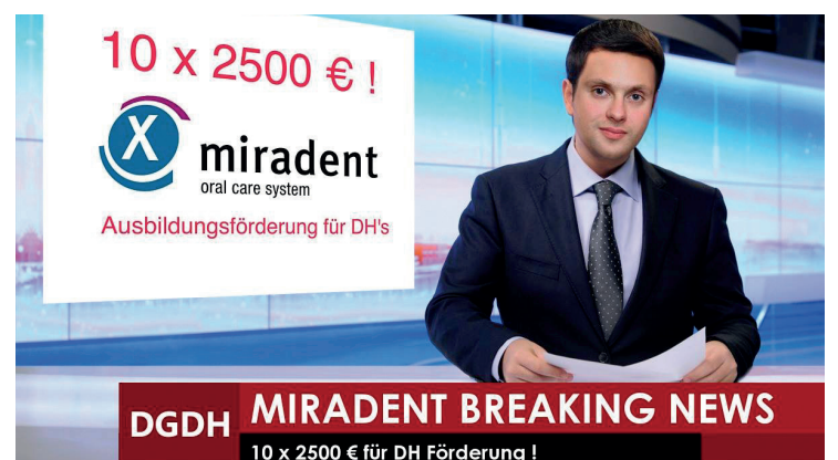
Die zehn Stipendiaten / Stipendiatinnen für das Jahr 2018 stehen fest.

Die Teilnehmer/-innen des miradent-Förderprogramms für Dentalhygienikerinnen 2018 stehen fest.