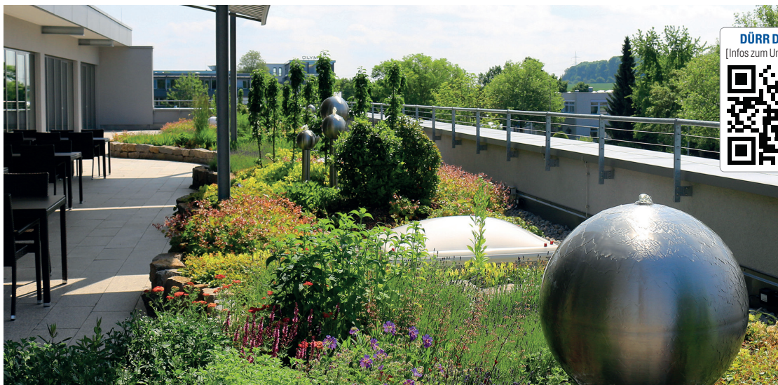
Botanische Oase – der preisgekrönte Firmendachgarten von Dürr Dental.

„Grüne Nachbarschaft“ zeichnet den Firmendachgarten von Dürr Dental aus.