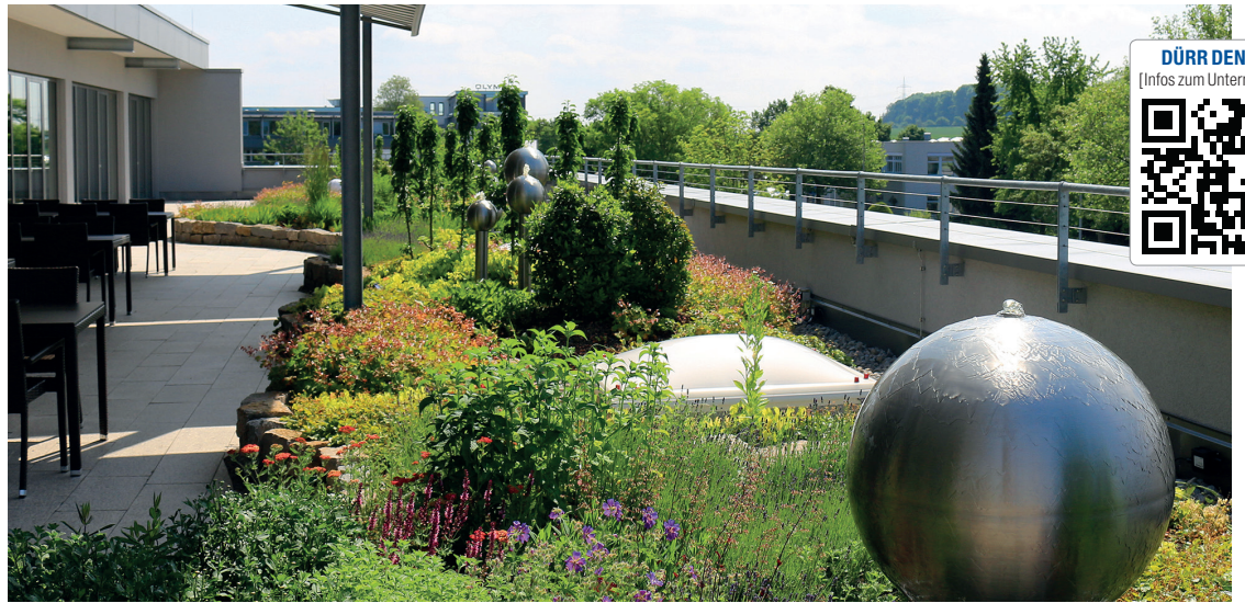
Botanische Oase – der preisgekrönte Firmendachgarten von Dürr Dental.

„Grüne Nachbarschaft“ zeichnet den Firmendachgarten von Dürr Dental aus.