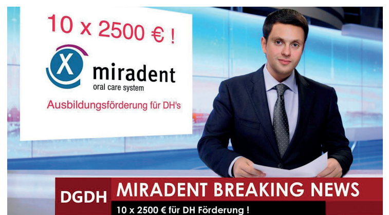
Die zehn Stipendiaten / Stipendiatinnen für das Jahr 2018 stehen fest.

Die Teilnehmer/-innen des miradent-Förderprogramms für Dentalhygienikerinnen 2018 stehen fest.